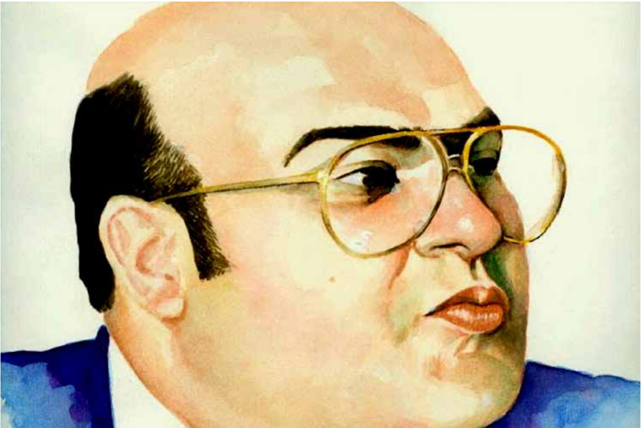
احتفل التيار الإسلامي بخروج قاتله بعفو رئاسي من الرئيس السابق محمد مرسي