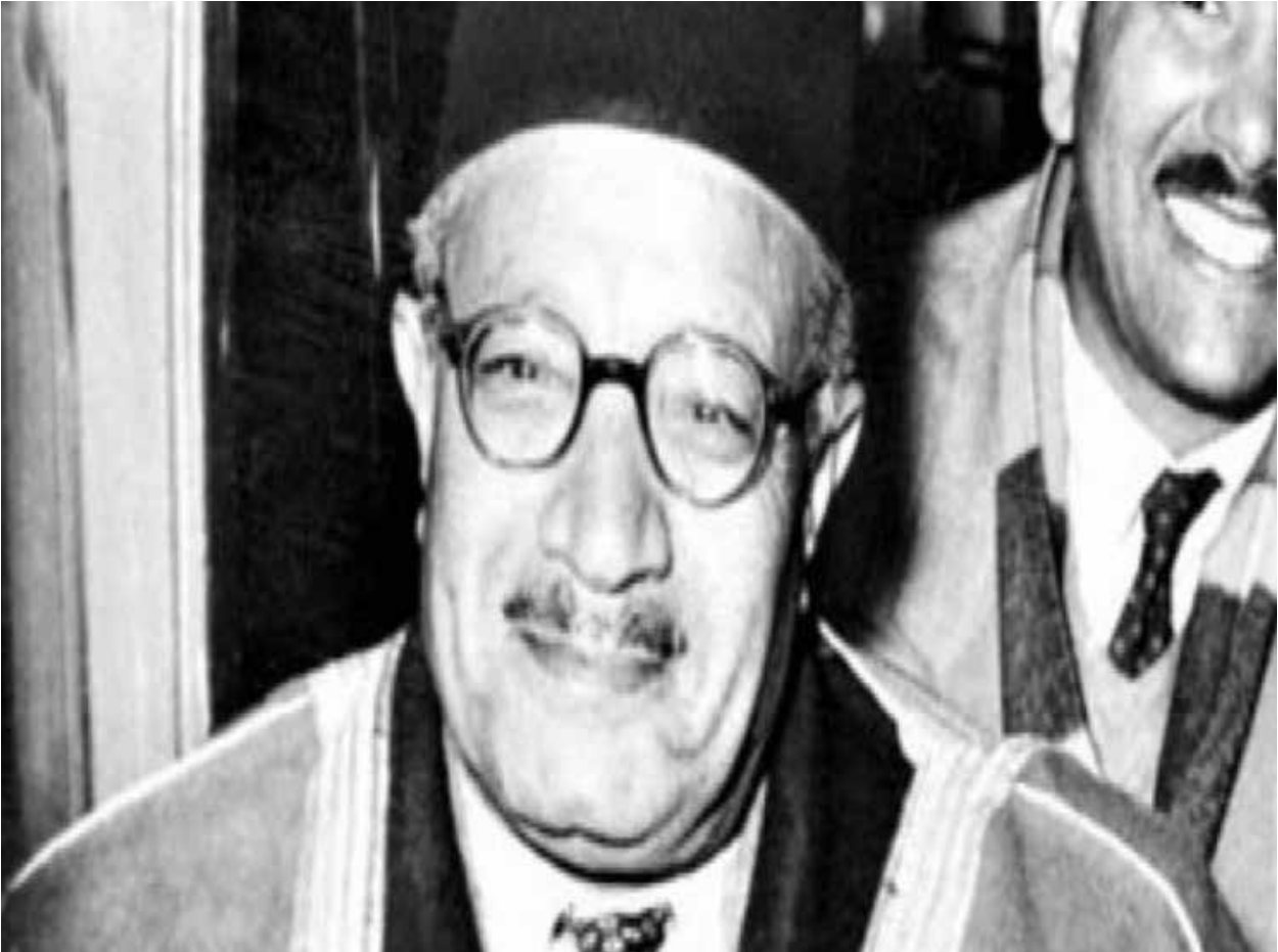
المرشد الثاني لجماعة الإخوان المسلمين: حسن الهضيبي