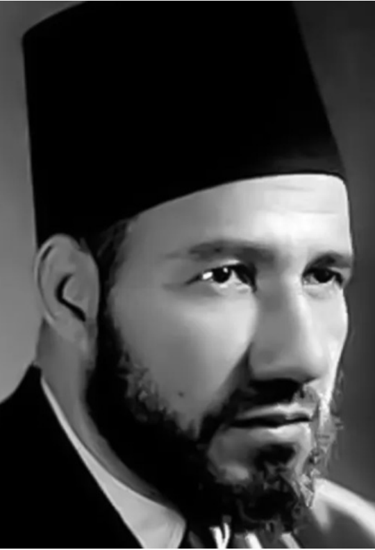
مؤسس جماعة الإخوان المسلمين: حسن البنا

محاولات عبد الناصر للاستفادة من ذلك الخلاف كانت عبارة عن مطالبات للهضيبي بحلّ التشكيلات السرية للإخوان داخل القوات المسلحة والشرطة، وسبق أن طالب أيضاً بحلّ النظام الخاص للتنظيم، وجميعها مطالبات قوبلت بالرفض، بيد أنّ تلك اللقاءات التي حدثت في غياب السندي وعدم مشاركته فيها ظنّ معها أنّها تعاون بين الهضيبي وضباط الثورة للانقضاض على التنظيم. لاحقاً نفى رئيس جهاز المخابرات العامة المصرية صلاح نصر تلك المسألة في مذكراته.