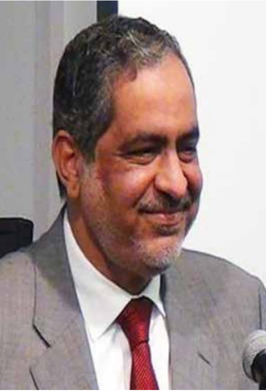
عضو جماعة الإخوان المسلمين السابق ومؤسس حزب الوسط: أبو العلا ماضي

يضيف ماضي: «تولّي مصطفى مشهور قسماً مهماً في الجماعة أطلقوا عليه الشباب والجامعات، وتُعتبر الجامعات المكان الذي كان فيه حركة إسلامية طلابية مستقلة، وأراد الإخوان أن يضمّوا أفرادها إلى الجماعة».