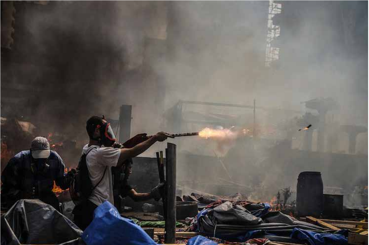
نتج عن عملية الاقتحام مقتل ٦٠٠ شخص بحسب التقديرات الرسمية

في أعقاب محاولة سيد قطب، إحياء تنظيم جماعة الإخوان المسلمين من جديد، للقيام بانقلاب ضد جمال عبد الناصر في الستينيات من القرن الماضي، وبعدما تأكد ناصر من وجود التنظيم، ألقى القبض على عدد كبير من القيادات، ومجموعة كبيرة من القطبيين حصلوا على أحكام بالسجن لمدة ١٠ سنوات، كما تم إعدام ٣ من كبار القيادات على رأسهم سيد قطب. وكان إعدامه سبباً لتأسيس مجموعات الجهاد المصرية التي انضم إليها لاحقاً أيمن الظواهري، زعيم تنظيم القاعدة حالياً.