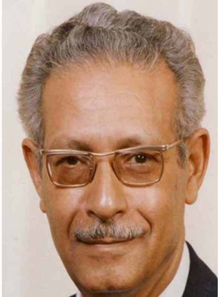
كُشِفَت الشبكة المنفذة للحادث والتي ضمت ٢٨ فرداً