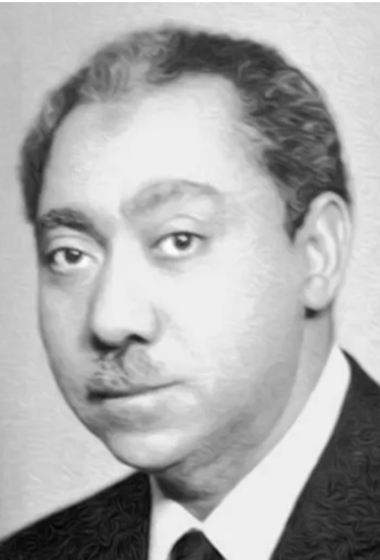
رئيس قسم نشر الدعوة في الجماعة ورئيس تحرير جريدة الإخوان المسلمون-آنذاك:- سيد قطب

في ذلك العام لم تنكشف فقط مخططات بعث الإخوان من جديد، لكن حدث التحول في شكل المواجهة بعد ذلك بعام، تحديداً عام ١٩٦٦، حين قرّر عدد من طلاب العلم تشكيل خلية الجهاد الأولى في القاهرة، هدفها السعي من أجل الانقلاب على حكم ناصر، حجتهم في ذلك أنّ جماعة الإخوان