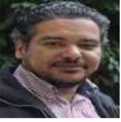
سامح فايز صحفي مصري

نفذت جماعات الإسلام السياسي المعاصرة، مجموعة من الاغتيالات السياسية؛ في محاولة لإرهاب الأنظمة الحاكمة المتعاقبة، غير أنّ تلك الاغتيالات جاءت بنتيجة عكسية، وكانت سبباً في مرور تلك الجماعات بأزمة عاصفة، وتوقف بعضها عن العمل الدعوي؛ نتيجة تصفية واعتقال قادتها، على خلفية تلك الاغتيالات.