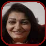
أنجيل الشاعر كاتبة سورية